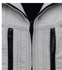
樹脂製ファスナー