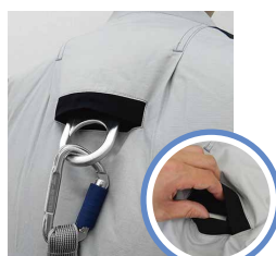
背面ランヤード取出口