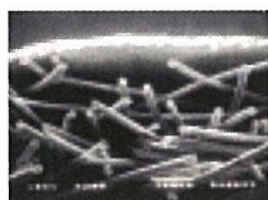
上層:通気性ポリエチレンフィルム 下層:ポリプロピレン スパンボンド不織布

ポリプロピレン スパンボンドに 通気性ポリエチレンフィルムをラミネートした製法。