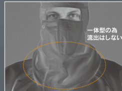
マスク・フード一体構造