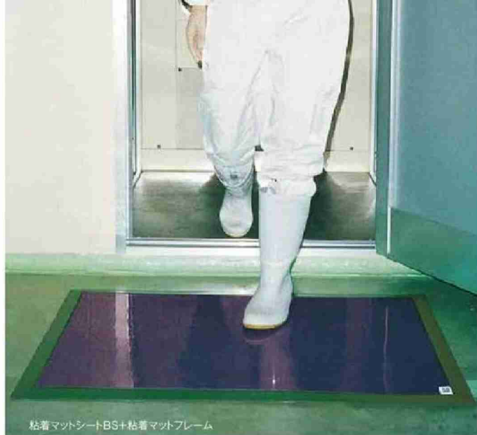
粘着マットシートBS+粘着マットフレーム