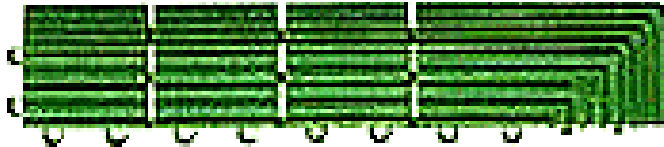
角ふちメス EA997RK - 11B

EA997RK - 10用 マットとして使う場合や段差をなくしたり、はね上がり等の危険防止に