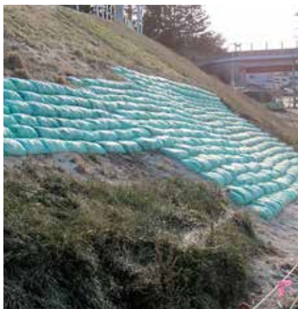
法面崩壊部分の埋戻し