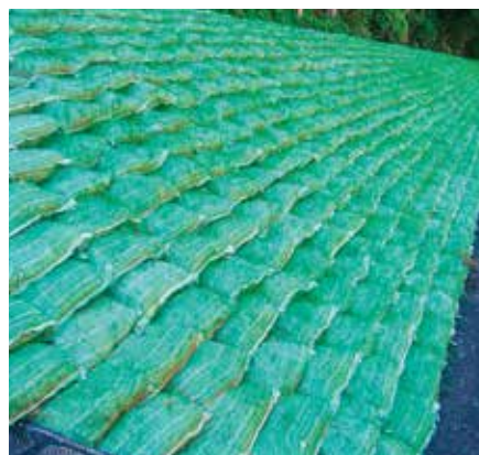
土留グリーンバッグ工