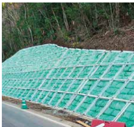
法枠グリーンバッグ工