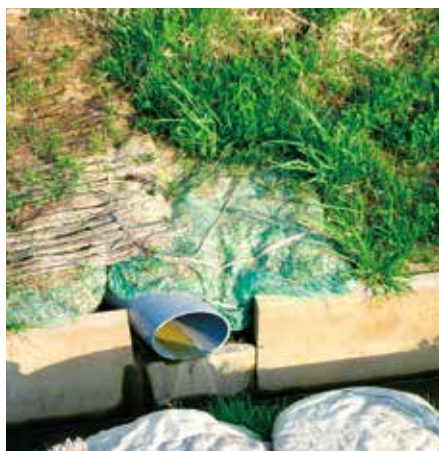
湧水箇所の崩壊防止