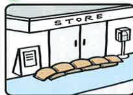
家屋、店舗、車庫等の浸水防止