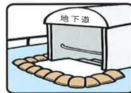
地下道、地階への流入防止