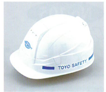
ヘルメット マーク入れ加工できます

従来の産業用ヘルメットをコンパクトに収納できます。又、防災用としても保管できます。