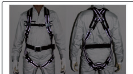
ライトを当てると、ハーネスが反射します（イメージ図）