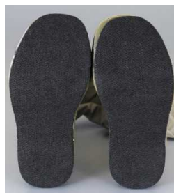
【先丸・フェルト底】