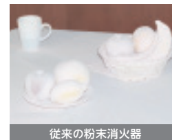
従来の粉末消火器

従来の粉末消火器は、部屋中に粉が飛散しますが、キッチンアイは薬剤を拭き取るだけで、後片付けが簡単です。