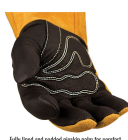
Fully lined and padded palm for comfort