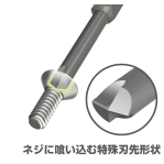
ネジに喰い込む特殊刃先形状