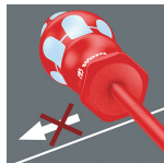
プラスドライバー ねじ対応表 中