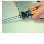
プラスドライバー おしり対応表