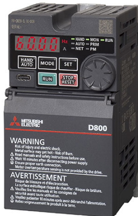
画像は代表型式のイメージです