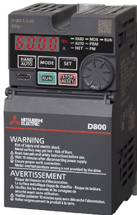
画像は代表型式のイメージです