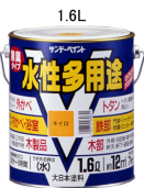
品番により色が変わります