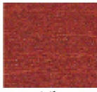
マホガニー (色見本)