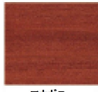
マホガニー (色見本)