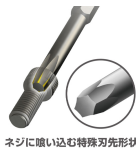
ネジに喰い込む特殊刃先形状