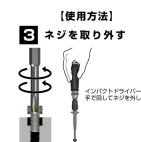
【使用方法】 3 ネジを取り外す