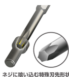
ネジに喰い込む特殊刃先形状