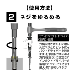
【使用方法】 2 ネジをゆるめる