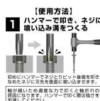
【使用方法】 1 ハンマーで叩き、ネジに喰い込み溝をつくる