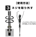
【使用方法】 3 ネジを取り外す