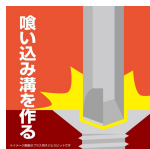
喰い込み溝を作る