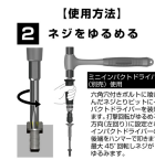
【使用方法】 2 ネジをゆるめる