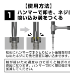
【使用方法】 1 ハンマーで叩き、ネジに喰い込み溝をつくる