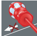
プラスドライバー ねじ対応表 中