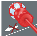
プラスドライバー ねじ対応表 中