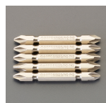
プラスドライバー ねじ対応表 中