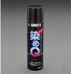
カラー EA942DM-1-ブラック EA942DM-2-ホワイト EA942DM-3-フリアンレッド EA942DM-4-ロイヤルブルー EA942DM-5-コスミックブルー EA942DM-6-サンイェロー EA942DM-7-クリアー EA942DM-8-シルバー EA942DM-9-モスグリーン